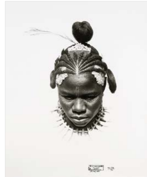
„Suku Sinero Kiko“, 1974