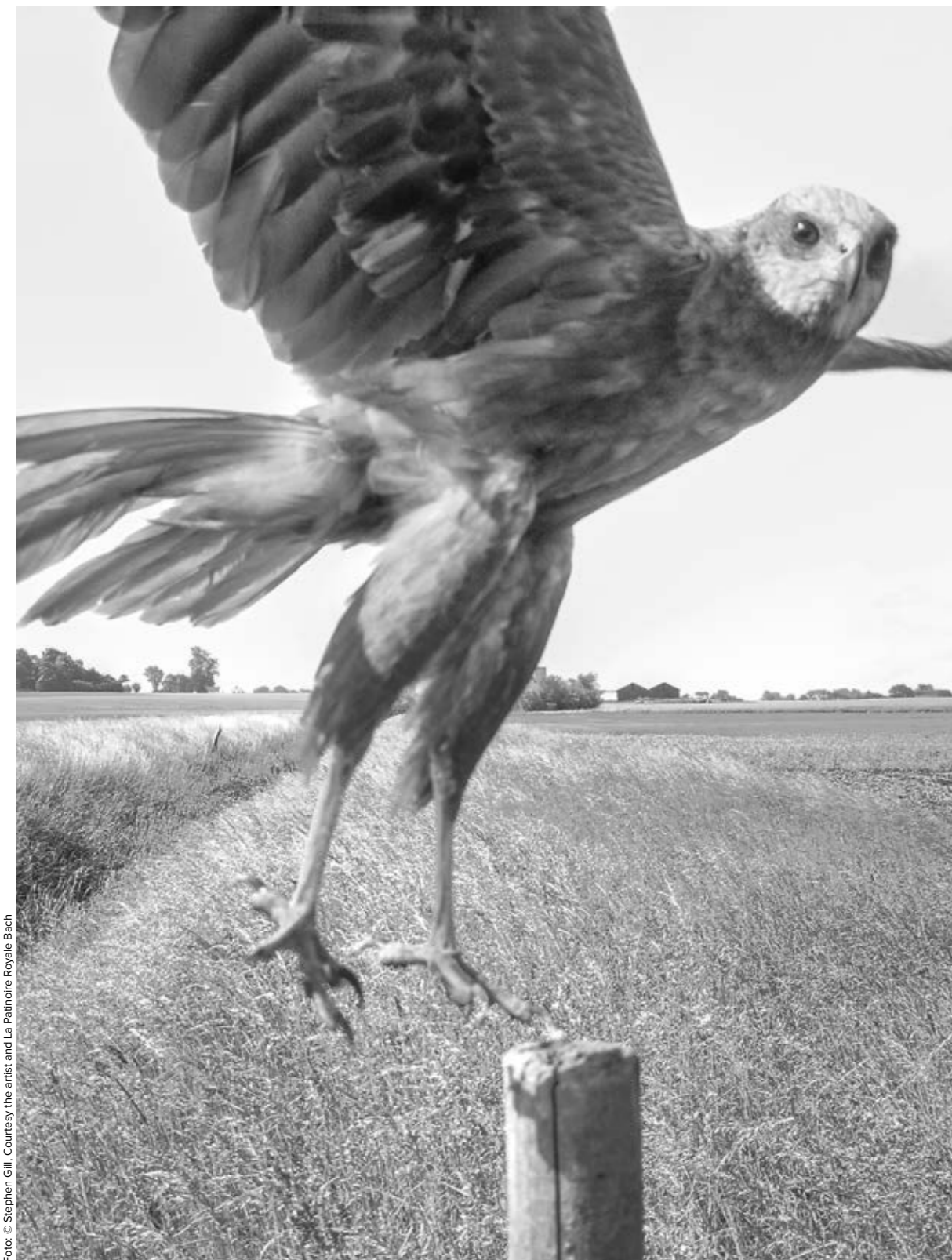
„The Pillar“, 2015–2019