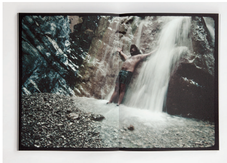
Doppelseiten aus: Andrew Phelps, cubic feet/sec., 2015, S. 12–13, 24–25, 56–57.

Grand-Canyon-Trips sichtete und als eine einzige große Reise anstatt als Anhäufung vieler kleiner wahrnahm, entdeckte er die Abenteuer und Erinnerungen der vergangenen 34 Jahre wieder. Er sah sich und seinen Vater immer älter werden, während der Canyon mehr oder weniger der gleiche blieb. Phelps, der eigentlich immer von autobiografischen Elementen ausgeht, um breitere globale Themen anzuschneiden, hatte verstanden, dass es in seinen Bildern nicht allein um vergnügliche Wildwasserfahrten, von denen er seinen Freunden bei Dia-Abenden erzählt, gehen könne.