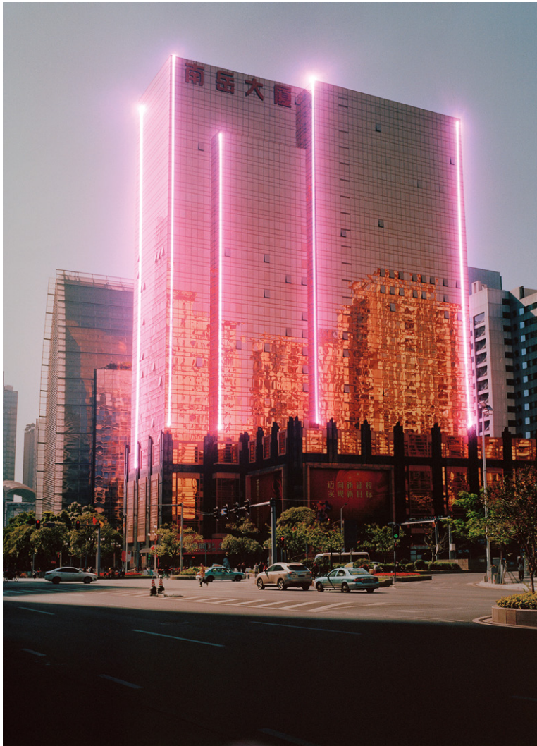
Future Memories 06, linehouse, © Nico Krebs & Taiyo Onorato

Umwelt zufrieden geben und etwas finden, das einen interessiert. Aber wenn ich meine Umwelt selbst konstruiere, habe ich etwas komplett Neues und bin dann auch der erste, der es fotografiert.