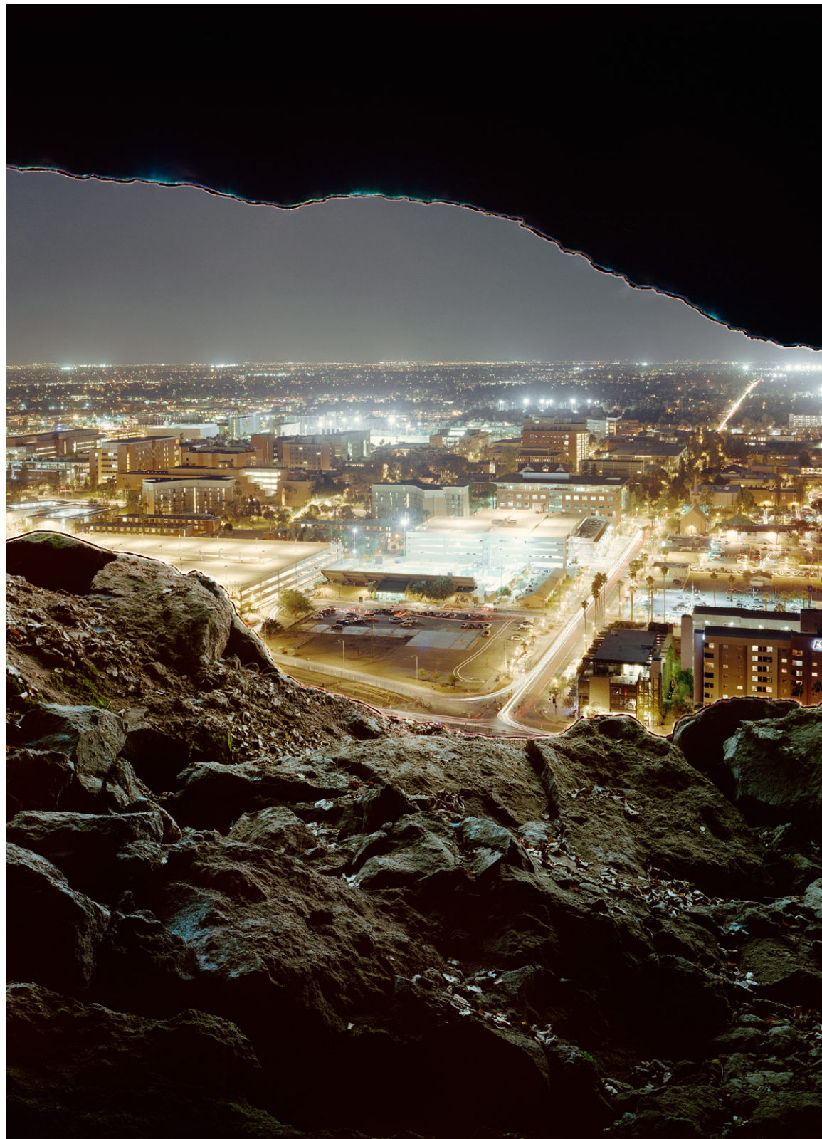
Future Memories 04, cave city, © Nico Krebs & Taiyo Onorato

Taiyo Onorato: Wir machen einen Scan von dem Negativ, das wir bearbeiten wollen, und machen in einem Vektor-Programm wie etwa Illustrator eine Linienzeichnung. Der Gravurlaser überträgt das dann sehr präzise auf das Negativ. Das Ergebnis ist aber dennoch nie wirklich perfekt. Es gibt auch kleine Verschiebungen, die wir aber begrüßen, denn es hat einen ganz eigenen Charme und die Kanten sehen immer auch etwas verbrannt aus. Außerdem kommen bei einem Farbnegativ andere Farbschichten zum Vorschein.