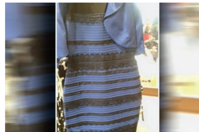
Dieses Foto wird unterschiedlich wahrgenommen: Manche sehen hier ein weiß-goldenes, andere ein schwarz-blaues Kleid.

1,2 Billionen Fotos wurden im vergangenen Jahr geschossen. 85 Prozent davon mit einem Smartphone. Man kann auch sagen: Heute fotografieren wir innerhalb einer Minute mehr als im gesamten 19. Jahrhundert. Tendenz: weiter steigend. Ein wichtiger Grund, warum wir heute so viel fotografieren, ist neben der kostengünstigen und technischen Voraussetzung durch die Verbreitung des Smartphones vor allem die Möglichkeit, Bilder mit anderen Menschen zu teilen – sei es in sozialen Netzwerken wie Facebook und Instagram oder über Nachrichtendienste wie Whatsapp , Telegram und den Facebook Messenger . Sie tragen wesentlich dazu bei, dass heute viel selbstverständlicher Fotos als Mittel der Kommunikation genutzt werden – und nicht mehr hauptsächlich als Medium der Erinnerung wie in den rund 180 Jahren zuvor. Der Fotokünstler Wolfgang Tillmans sprach 2014 in einem Interview mit dem britischen Guardian davon, dass Fotografien Wörter als Nachrichtenmedium gar ersetzen würden. Andere werden nicht müde zu betonen, dass die Fotografie ein „visuelles Esperanto“ sei. Doch ist dem wirklich so? Können Fotografien überall verstanden oder zumindest gelesen werden? Und wenn ja: Wo lernt man das? Schließlich gibt es für den Umgang mit Fotos kein Lexikon wie in der Traumdeutung, in dem man nachschlagen könnte, was beispielsweise ein Mann mit Plastiktüten vor einer Reihe von Panzern, eine elegante Frau im